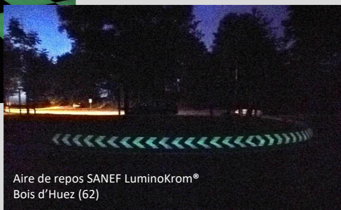
Aire de repos SANEF LuminoKrom® Bois d'Huez (62)