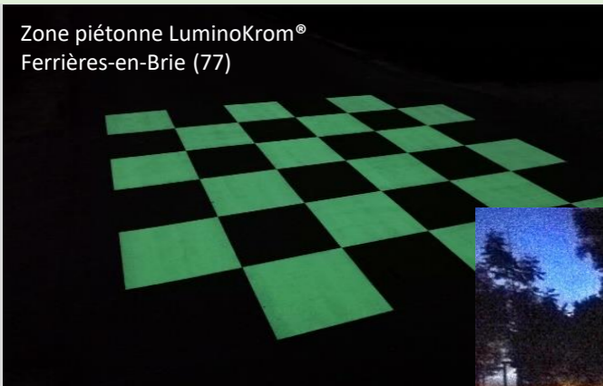
Zone piétonne LuminoKrom® Ferrières-en-Brie (77)

La peinture LuminoKrom® est également recommandée pour créer un « guide lumineux » sur les quais et pontons des ports de plaisance et bordures de rivières afin d'éviter les risques de chute dans l'eau.