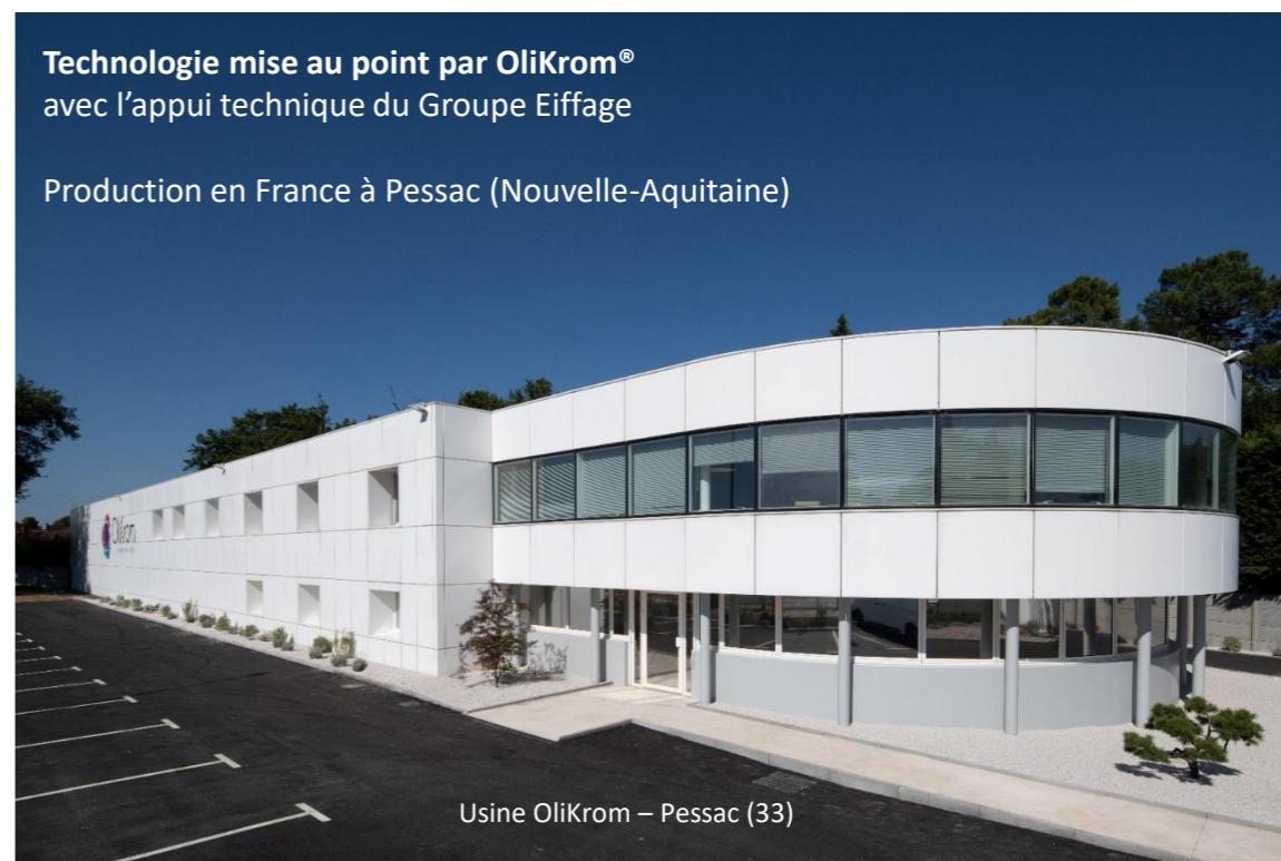
Usine OliKrom – Pessac (33)

Production en France à Pessac (Nouvelle-Aquitaine)